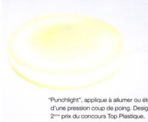
"Punchlight", applique à allumer ou éteindre d'une pression coup de poing. Design Jean-Marc Gady . 2 ème prix du concours Top Plastique.