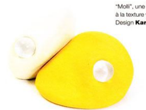
"Molli", une lampe malléable à la texture velouté. Design Karine Mallet et Arnaud Lucas .